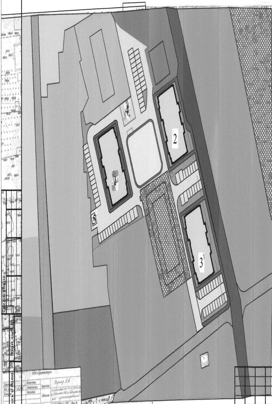
ВЕДОМОСТЬ ЗДАНИЙ И СООРУЖЕНИЙ

План планировки территории с отображением границ зон планируемого размещения объектов капитального строительства.