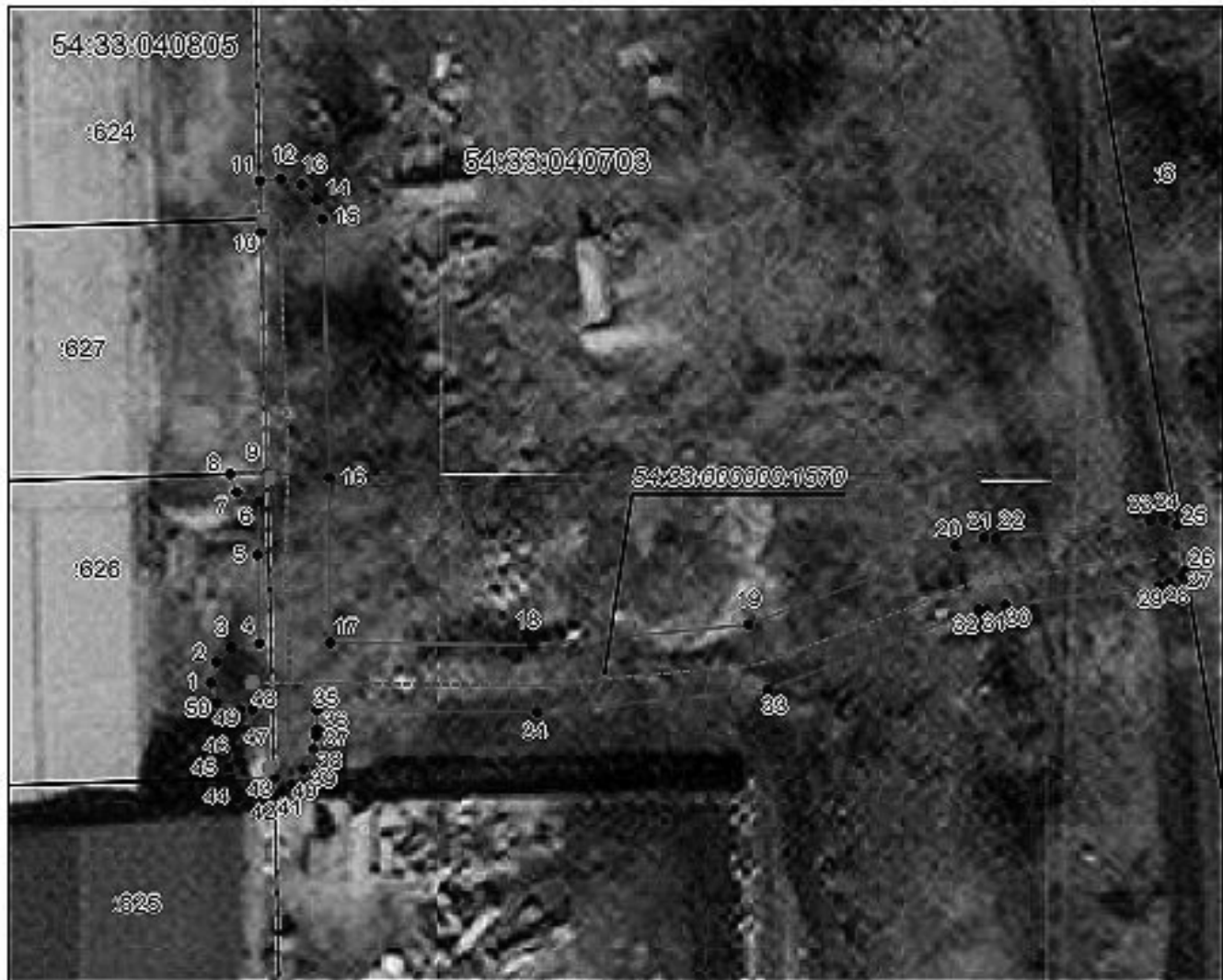
Масштаб 1: 500

(кадастровый номер объекта, местоположение границ которого описано)